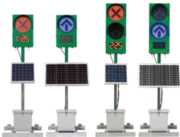
IGS125DS IGS125DS3 IGS225DS IGS225DS3