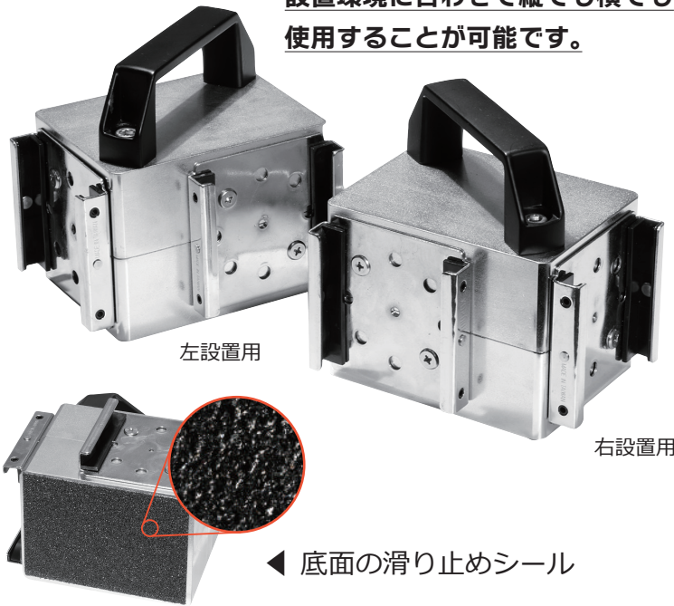
◀ 底面の滑り止めシール