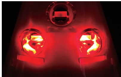
高輝度 LED とレンズの効果で明るく大きく光ります。