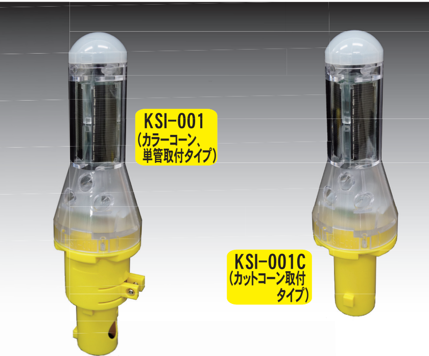
KSI-001 (カラーコーン、 単管取付タイプ)