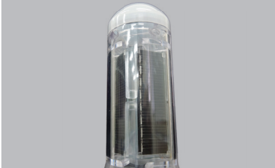
4枚のソーラーパネルを垂直に設置する事で、冬季の発電量の低下を防ぎます。