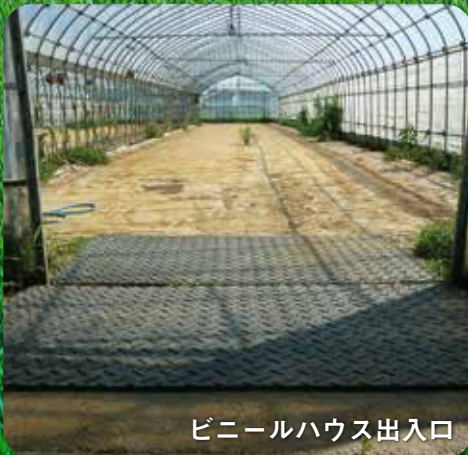
ビニールハウス出入口